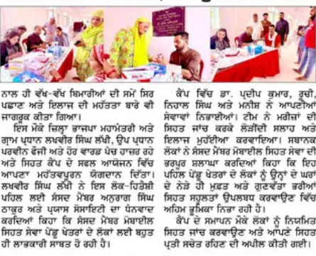
ਸੰਸਦ ਮੈਂਬਰ ਮੋਬਾਈਲ ਸਿਹਤ ਸੇਵਾ ਦੇ ਕੈਂਪ 'ਚ 110 ਮਰੀਜ਼ਾਂ ਦੀ ਜਾਂਚ ਕੀਤੀ ਗਈ ਅਤੇ 85 ਮੁਫ਼ਤ ਲੈਬ ਟੈਸਟ ਕੀਤੇ ਗਏ।

ਪੈਗਮ-ਏ-ਜਗਤ/ਹਰੋਲੀ/ਉਨਾ 7 ਜੁਲਾਈ (ਰਾਜਕੀਰ ਚੰਬਰਾ) ਸਾਬਕਾ ਕੌਂਸਲਰ ਮੰਤਰੀ ਅਤੇ ਡੀ.ਐਚ.ਐਸ. ਡਾ. ਗੋਂਦਪੁਰ ਜੈਚੰਦ ਵਿੱਚ ਸੰਸਦ ਮੈਂਬਰ ਮੋਬਾਈਲ ਸਿਹਤ ਸੇਵਾ ਦੇ ਕੈਂਪ 'ਚ 110 ਮਰੀਜ਼ਾਂ ਦੀ ਜਾਂਚ ਕੀਤੀ ਗਈ ਅਤੇ 85 ਮੁਫ਼ਤ ਲੈਬ ਟੈਸਟ ਕੀਤੇ ਗਏ। ਇਸ ਤੋਂ ਇਲਾਵਾ ਮਰੀਜ਼ਾਂ ਨੂੰ ਲੋੜ ਅਨੁਸਾਰ ਡਾਕਟਰੀ ਸਲਾਹ, ਮੁਫ਼ਤ ਵਾਇਬੀਓ ਅਤੇ ਸਿਹਤ ਸੰਬੰਧੀ ਮੁਹੱਤਵਪੂਰਨ ਜਾਣਕਾਰੀ ਵੀ ਦਿੱਤੀ ਗਈ।