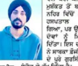
ਕੈਨੇਡਾ ਤੋਂ ਇੱਕ ਬੰਦੇ ਸੰਦਰਭਾਗੀ ਬਰ ਸਾਹਮਣੇ ਆਈ ਹੈ, ਜਿਸ ਨਹਿਰ ਵਿੱਚ ਡੁੱਬਦੇ ਦੋਸਤ ਨੂੰ ਬਚਾਉਣ ਲਈ ਕੈਨੇਡਾ ਸਰਕਾਰ ਨੇ 26 ਸਾਲਾ ਨੌਜਵਾਨ ਨਿਰਾਸ਼ਰਿਤ ਸਿੱਖ ਦੀ ਮੌਤ ਦੀ ਸਜ਼ਾ ਨੂੰ ਮੁੜੀ ਗਈ।

ਕੈਨੇਡਾ ਤੋਂ ਇੱਕ ਬੰਦੇ ਸੰਦਰਭਾਗੀ ਬਰ ਸਾਹਮਣੇ ਆਈ ਹੈ, ਜਿਸ ਨਹਿਰ ਵਿੱਚ ਡੁੱਬਦੇ ਦੋਸਤ ਨੂੰ ਬਚਾਉਣ ਲਈ ਕੈਨੇਡਾ ਸਰਕਾਰ ਨੇ 26 ਸਾਲਾ ਨੌਜਵਾਨ ਨਿਰਾਸ਼ਰਿਤ ਸਿੱਖ ਦੀ ਮੌਤ ਦੀ ਸਜ਼ਾ ਨੂੰ ਮੁੜੀ ਗਈ। ਕੈਨੇਡਾ ਤੋਂ ਇੱਕ ਬੰਦੇ ਸੰਦਰਭਾਗੀ ਬਰ ਸਾਹਮਣੇ ਆਈ ਹੈ, ਜਿਸ ਨਹਿਰ ਵਿੱਚ ਡੁੱਬਦੇ ਦੋਸਤ ਨੂੰ ਬਚਾਉਣ ਲਈ ਕੈਨੇਡਾ ਸਰਕਾਰ ਨੇ 26 ਸਾਲਾ ਨੌਜਵਾਨ ਨਿਰਾਸ਼ਰਿਤ ਸਿੱਖ ਦੀ ਮੌਤ ਦੀ ਸਜ਼ਾ ਨੂੰ ਮੁੜੀ ਗਈ।