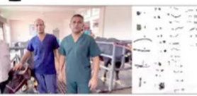
ਪੈਗਮ-ਏ-ਜਗਤ/ਹਰੋਲੀ/ਉਨਾ, 7 ਜੁਲਾਈ ਪਸ਼ੂ ਹਸਪਤਾਲ ਪੈਗਮ-ਏ-ਜਗਤ ਵਿੱਚ 32 ਨੁਕੀਲੀਆਂ ਲੋਹੇ ਦੀਆਂ ਕੀਲਾਂ ਸੋਝੇ ਹੋਰ ਪਾੜੂ ਦੇ ਟੁਕੜੇ ਵੱਧੇ।

ਪੇਟ ਵਿੱਚ 32 ਨੁਕੀਲੀਆਂ ਲੋਹੇ ਦੀਆਂ ਕੀਲਾਂ ਸੋਝੇ ਹੋਰ ਪਾੜੂ ਦੇ ਟੁਕੜੇ ਵੱਧੇ ਪੈਗਮ-ਏ-ਜਗਤ/ਹਰੋਲੀ/ਉਨਾ, 7 ਜੁਲਾਈ ਪਸ਼ੂ ਹਸਪਤਾਲ ਪੈਗਮ-ਏ-ਜਗਤ ਵਿੱਚ 32 ਨੁਕੀਲੀਆਂ ਲੋਹੇ ਦੀਆਂ ਕੀਲਾਂ ਸੋਝੇ ਹੋਰ ਪਾੜੂ ਦੇ ਟੁਕੜੇ ਵੱਧੇ।