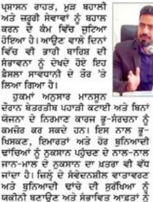
ਉਨਾ ਵਿੱਚ ਮਾਨਸੂਨ ਦੇ ਮੌਸਮ 30 ਸਤੰਬਰ ਤੱਕ ਪਹਾੜੀ ਕਟਾਈ 'ਤੇ ਪਾਬੰਦੀ ਲਗਾਈ ਜਾਵੇਗੀ।

ਉਨਾ, 7 ਜੁਲਾਈ (ਪੈਗਮ-ਏ-ਜਗਤ) ਉਨਾ ਵਿੱਚ ਮਾਨਸੂਨ ਦੇ ਮੌਸਮ 30 ਸਤੰਬਰ ਤੱਕ ਪਹਾੜੀ ਕਟਾਈ 'ਤੇ ਪਾਬੰਦੀ ਲਗਾਈ ਜਾਵੇਗੀ। ਇਹ ਡਿਪਾਰਟਮੈਂਟ ਨੇ ਮੌਸਮੀ ਮੁਲਾਂਕਣ ਕਰਦੇ ਹੋਏ ਦੱਸਿਆ ਹੈ। ਮੌਸਮੀ ਮੁਲਾਂਕਣ ਅਨੁਸਾਰ ਮੌਸਮ 30 ਸਤੰਬਰ ਤੱਕ ਪਹਾੜੀ ਕਟਾਈ 'ਤੇ ਪਾਬੰਦੀ ਲਗਾਈ ਜਾਵੇਗੀ। ਇਹ ਡਿਪਾਰਟਮੈਂਟ ਨੇ ਮੌਸਮੀ ਮੁਲਾਂਕਣ ਕਰਦੇ ਹੋਏ ਦੱਸਿਆ ਹੈ। ਮੌਸਮੀ ਮੁਲਾਂਕਣ ਅਨੁਸਾਰ ਮੌਸਮ 30 ਸਤੰਬਰ ਤੱਕ ਪਹਾੜੀ ਕਟਾਈ 'ਤੇ ਪਾਬੰਦੀ ਲਗਾਈ ਜਾਵੇਗੀ।