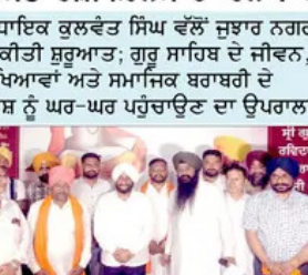
ਸ਼੍ਰੀ ਗੁਰੂ ਗ੍ਰੰਥ ਸਾਹਿਬ ਜੀ ਦੇ 650ਵੇਂ ਪ੍ਰਕਾਸ਼ ਪੁਸਤਕ ਨੂੰ ਸਮਰਪਿਤ ਪੰਜਾਬ ਸਰਕਾਰ ਵੱਲੋਂ ਤਿਆਰ ਵਿਸ਼ੇਸ਼ ਦਸਤਾਵੇਜ਼ੀ ਫ਼ਿਲਮ ਦਾ ਹਲਕਾ ਮੋਹਾਲੀ ਤੋਂ ਆਗਾਜ਼।