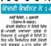
ਨਵੀਂ ਦਿੱਲੀ, 1 ਜੁਲਾਈ (ਪੈਗਮ-ਏ-ਜਗਤ)

ਕੇਂਦਰੀ ਕੋਥਨਿਟ ਨੇ 14,115 ਕਰੜ ਦੇ ਪ੍ਰੋਜੈਕਟਾਂ ਨੂੰ ਮਨਜ਼ੂਰੀ ਦਿੱਤੀ