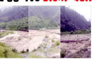
ਜੰਮੂ, 1 ਜੁਲਾਈ (ਪੈਗਮ-ਏ-ਜਗਤ)

ਫਸਲਾਂ, ਬਾਗਾਂ ਅਤੇ ਜਾਇਦਾਦ ਨੂੰ ਭਾਰੀ ਨੁਕਸਾਨ ਪਹੁੰਚਿਆ, ਮਲਬੇ ਕਾਰਨ ਕਈ ਸੜਕਾਂ ਬੰਦ ਹੋ ਗਈਆਂ