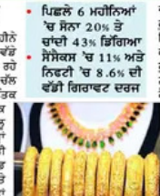
ਬੰਗਲੁਰ, 1 ਜੁਲਾਈ (ਪੈਗਮ-ਏ-ਜਗਤ)

ਪਿਛਲੇ ਛੇ ਮਹੀਨਿਆਂ ਦੇ ਵਿੱਚ ਪਹਿਲੀ ਵਾਰ 20 ਡੀਸਟ ਗਿਰਾਵਟ