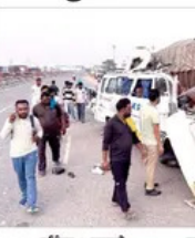
ਬੰਨਣਾ, 1 ਜੁਲਾਈ (ਪੈਗਮ-ਏ-ਜਗਤ)

ਅਮਰਨਾਥ ਯਾਤਰਾ 'ਤੇ ਜਾ ਰਹੇ ਚਾਰ ਸ਼ਰਧਾਲੂਆਂ ਦੀ ਮੌਤ, ਸੱਤ ਜ਼ਖ਼ਮੀ