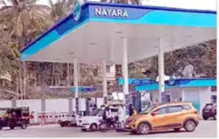
ਪੈਟਰੋਲ 5 ਅਤੇ ਡੀਜ਼ਲ 3 ਰੁਪਏ ਪ੍ਰਤੀ ਲੀਟਰ ਦੀ ਕਟੌਤੀ

ਜਿਸ ਨਾਲ ਦਿੱਲੀ ਵਿੱਚ ਇਸ ਦੀ ਕੀਮਤ ਕਰੀਬ 110 ਰੁਪਏ ਪ੍ਰਤੀ ਲੀਟਰ ਹੋਵੇ