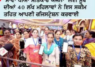
ਪੰਜਾਬ ਦੇ ਮੁੱਖ ਮੰਤਰੀ ਭਗਵੰਤ ਸਿੰਘ ਮਾਨ ਨੇ ਸ਼ਿਕਾਰੂ ਜਿਲ੍ਹੇ ਦੇ ਆਪਣੇ ਵਿਧਾਨ ਸਭਾ ਹਲਕੇ ਸੂਰੀ ਸ਼ਹਿਰ ਵਿੱਚ ਆਮ ਆਦਮੀ ਪਾਰਟੀ ਸੁਭਾਵ ਦੀ ਇੱਕ ਅਹਿਮ ਅਤੇ ਵੱਡੀ ਸਮੀਕਾ ਮੁੱਖ ਮੰਤਰੀ ਮਹਾਂ ਚੀਫਾ ਸਤਿਕਾਰ ਯੋਜਨਾ ਦੀ ਸੁਭਾਅਤ ਕੀਤੀ ਹੈ। ਇਸ ਉਦਘਾਟਨੀ ਸਮਾਰੋਹ ਵਿੱਚ ਸੂਰੀ ਸ਼ਹਿਰ ਵਿੱਚ ਲੱਖ ਪ੍ਰਤੀ, ਜਿਨ੍ਹਾਂ ਵਿੱਚ ਮੁੱਖ ਤੌਰ 'ਤੇ ਪ੍ਰਤੀ ਅਤੇ ਆਲੋਚਨਾ ਦੇ ਇਲਾਜ਼ਿਆਂ ਦੀਆਂ ਮਹਿਲਾਵਾਂ ਸ਼ਾਮਲ ਸਨ।

ਮਾਵਾਂ ਦੀਆਂ ਸਤਿਕਾਰ ਯੋਜਨਾ ਲਈ ਸੂਬੇ ਦੀਆਂ 40 ਲੱਖ ਮਹਿਲਾਵਾਂ ਨੇ ਇਸ ਸਕੀਮ ਤਹਿਤ ਆਪਣੀ ਰਜਿਸਟ੍ਰੇਸ਼ਨ ਕਰਵਾਈ