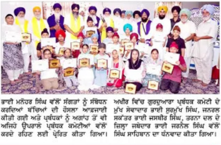
ਖਾਰਮਿਕ ਵਿਦਿਆ ਦੇ ਨਾਲ ਨਾਲ ਕੀਤੀ ਗਈ, ਕਬਾ ਵਿਚਾਰਾਂ, ਗੁਰਦੁਆਰਾ ਸਿਖਲਾਈ ਕੈਂਪ ਅਤੇ ਬਦ ਗੁਰੂ ਸੀ ਦੇ ਨਾਲ ਜੋੜਨ ਲਈ ਗੁਰਮਤਿ ਸਿਖਲਾਈ ਕੈਂਪ ਦਾ ਆਯੋਜਨ ਕੀਤਾ ਗਿਆ। ਕੈਂਪ ਦੇ ਆਰਗੀ ਵਿਨ ਪੱਧ ਸਿੱਖ ਸਾਹਿਬਾਨ ਨੀ ਦੀ ਹਾਜ਼ਰੀ ਵਿੱਚ ਬੱਚਿਆਂ ਲਈ ਇਨਾਮ ਪੱਧ ਸਮਾਗਮ ਰੱਖਿਆ ਗਿਆ ਜਿਸ ਦੌਰਾਨ ਪੁੱਛੀ, ਦੂਜੀ ਅਤੇ ਤੀਜੀ ਪੁਸ਼ੀਕਾ ਨੇ ਆਉਣ ਵਾਲੇ ਬੱਚਿਆਂ ਨੂੰ ਪ੍ਰਾਦਰਸ਼ੀ ਕੀਤੀ ਅਤੇ ਸਰਟੀਫਿਕੇਟ ਦੇ ਸਮਾਗਮ ਕੀਤੇ ਗਏ। ਡੀ.ਬੀ.ਜੀ. ਦੀ ਪੁੱਛਗਿੱਛੀ ਕਮੇਟੀ ਨੇ ਦਰਫਤ ਕੇਸ ਨੂੰ ਸਨਅਤਿਤ ਕੀਤਾ। ਉਨ੍ਹਾਂ ਨੂੰ ਪੱਟ ਭਰ ਜੇਲ੍ਹ ਭੇਜਣ ਦਾ ਆਨੰਦ ਪ੍ਰਾਪਤ ਕੀਤਾ।

ਖਰੜ, 29 ਜੂਨ (ਪੈਗਮ-ਏ-ਜਗਤ) ਗੁਰਦੁਆਰਾ ਸ੍ਰੀ ਗੁਰੂ ਤੇਗ ਬਹਾਦਰ ਸਾਹਿਬ, ਗੁਰੂ ਤੇਗ ਬਹਾਦਰ ਨਗਰ ਖਰੜ ਵਿਖੇ ਗੁਰਮਤਿ ਸਿੱਖ ਆਈ ਡੀ.ਐਮ. ਚੰਦਾ ਪੱਧਰ ਤੋਂ ਖਾਰਮਿਕ ਵਿਦਿਆ ਦੇ ਨਾਲ ਨਾਲ ਕੀਤੀ ਗਈ, ਕਬਾ ਵਿਚਾਰਾਂ, ਗੁਰਦੁਆਰਾ ਸਿਖਲਾਈ ਕੈਂਪ ਅਤੇ ਬਦ ਗੁਰੂ ਸੀ ਦੇ ਨਾਲ ਜੋੜਨ ਲਈ ਗੁਰਮਤਿ ਸਿਖਲਾਈ ਕੈਂਪ ਦਾ ਆਯੋਜਨ ਕੀਤਾ ਗਿਆ। ਕੈਂਪ ਦੇ ਆਰਗੀ ਵਿਨ ਪੱਧ ਸਿੱਖ ਸਾਹਿਬਾਨ ਨੀ ਦੀ ਹਾਜ਼ਰੀ ਵਿੱਚ ਬੱਚਿਆਂ ਲਈ ਇਨਾਮ ਪੱਧ ਸਮਾਗਮ ਰੱਖਿਆ ਗਿਆ ਜਿਸ ਦੌਰਾਨ ਪੁੱਛੀ, ਦੂਜੀ ਅਤੇ ਤੀਜੀ ਪੁਸ਼ੀਕਾ ਨੇ ਆਉਣ ਵਾਲੇ ਬੱਚਿਆਂ ਨੂੰ ਪ੍ਰਾਦਰਸ਼ੀ ਕੀਤੀ ਅਤੇ ਸਰਟੀਫਿਕੇਟ ਦੇ ਸਮਾਗਮ ਕੀਤੇ ਗਏ। ਡੀ.ਬੀ.ਜੀ. ਦੀ ਪੁੱਛਗਿੱਛੀ ਕਮੇਟੀ ਨੇ ਦਰਫਤ ਕੇਸ ਨੂੰ ਸਨਅਤਿਤ ਕੀਤਾ। ਉਨ੍ਹਾਂ ਨੂੰ ਪੱਟ ਭਰ ਜੇਲ੍ਹ ਭੇਜਣ ਦਾ ਆਨੰਦ ਪ੍ਰਾਪਤ ਕੀਤਾ।