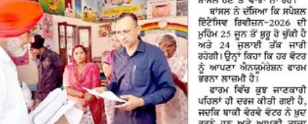
ਉਨ੍ਹਾਂ ਵੱਟਾਂ ਨੂੰ ਅਪੀਲ ਕੀਤੀ ਕਿ ਉਹ ਚੱਲ ਰਹੀ ਸਪੈਸ਼ਲ ਇੰਟੈਲਿਜੈਂਸ ਰਿਵੀਜ਼ਨ-2026 ਦੇ ਦੌਰਾਨ ਬੀ.ਐਲ.ਓ. ਦਾ ਪੂਰਾ ਸਿੱਧਿਕਾਰ ਕਰਨ, ਤਾਂ ਜੋ ਕੋਈ ਵੀ ਸਿੱਧਿਕਾਰ ਨਾ ਹੋਵੇ। ਉਨ੍ਹਾਂ ਕਿਹਾ ਕਿ ਸਪੈਸ਼ਲ ਇੰਟੈਲਿਜੈਂਸ ਰਿਵੀਜ਼ਨ-2026 ਦੀ ਪ੍ਰਗਤੀ ਤੱਕ ਜਾਰੀ ਰਹੇਗੀ। ਉਨ੍ਹਾਂ ਕਿਹਾ ਕਿ ਹਰ ਵੱਟ ਦੌਰਾਨ ਨੂੰ ਆਪਣਾ ਐਨਯੂਮੈਰੇਸ਼ਨ ਵਾਰਡ ਭਰਨਾ ਲਾਜ਼ਮੀ ਹੈ। ਵਾਰਡ ਵਿੱਚ ਕੁਝ ਯਾਤਰਾ ਕੀਤੀ ਗਈ ਹੈ, ਜਦਕਿ ਬਾਕੀ ਵੱਟਾਂ ਦੌਰਾਨ ਨੂੰ ਖੁਦ ਭਰਨ ਹਨ ਅਤੇ ਆਪਣੀ ਤਾਜ਼ਾ ਪਾਸਪੋਰਟ ਆਕਾਰ ਦੇ ਡੱਲ ਵਾਲੇ ਸਬੰਧਤ ਬੀ.ਐਲ.ਓ. ਕੋਲ ਨਿਰਧਾਰਤ ਸਮੇਂ ਆਉਣ ਵਾਲੇ ਕਾਰਵਾਈ ਤੋਂ ਉਨ੍ਹਾਂ ਕਿਹਾ ਕਿ ਸਪੈਸ਼ਲ ਇੰਟੈਲਿਜੈਂਸ ਰਿਵੀਜ਼ਨ-2026 ਦੀ ਪ੍ਰਗਤੀ ਤੱਕ ਜਾਰੀ ਰਹੇਗੀ। ਉਨ੍ਹਾਂ ਕਿਹਾ ਕਿ ਹਰ ਵੱਟ ਦੌਰਾਨ ਨੂੰ ਆਪਣਾ ਐਨਯੂਮੈਰੇਸ਼ਨ ਵਾਰਡ ਭਰਨਾ ਲਾਜ਼ਮੀ ਹੈ। ਵਾਰਡ ਵਿੱਚ ਕੁਝ ਯਾਤਰਾ ਕੀਤੀ ਗਈ ਹੈ, ਜਦਕਿ ਬਾਕੀ ਵੱਟਾਂ ਦੌਰਾਨ ਨੂੰ ਖੁਦ ਭਰਨ ਹਨ ਅਤੇ ਆਪਣੀ ਤਾਜ਼ਾ ਪਾਸਪੋਰਟ ਆਕਾਰ ਦੇ ਡੱਲ ਵਾਲੇ ਸਬੰਧਤ ਬੀ.ਐਲ.ਓ. ਕੋਲ ਨਿਰਧਾਰਤ ਸਮੇਂ ਆਉਣ ਵਾਲੇ ਕਾਰਵਾਈ ਤੋਂ ਉਨ੍ਹਾਂ ਕਿਹਾ ਕਿ ਸਪੈਸ਼ਲ ਇੰਟੈਲਿਜੈਂਸ ਰਿਵੀਜ਼ਨ-2026 ਦੀ ਪ੍ਰਗਤੀ ਤੱਕ ਜਾਰੀ ਰਹੇਗੀ। ਉਨ੍ਹਾਂ ਕਿਹਾ ਕਿ ਹਰ ਵੱਟ ਦੌਰਾਨ ਨੂੰ ਆਪਣਾ ਐਨਯੂਮੈਰੇਸ਼ਨ ਵਾਰਡ ਭਰਨਾ ਲਾਜ਼ਮੀ ਹੈ।