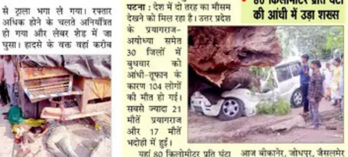
मलोट में मजदूरों पर चढ़ा बेकाबू ट्राला, दो की मौत

मलोट, 14 मई (पैगाम-ए-जगत) - मलोट नेमनल हाईवे पर लेबर चोक में आज सुबह करीब 8 बजे एक बेकाबू ट्राला ने दो व्यक्तियों को बुरी तरह से रौंटी दिया। ट्रक के पीछे के टायरों में कोंडे होने से ट्रक की मोर्च पर ही दर्दनाक मौत हो गई, जबकि ट्राला चालक घायल हो गया जिसकी हालत भी गंभीर बताई जा रही है जिसे सिलिव अस्पताल मलोट से भर्तीकरीट रेफर कर दिया गया।