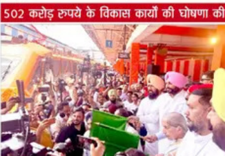
502 करोड़ रुपये के विकास कार्यों की घोषणा की

अमृतसर, 14 मई (पैगाम-ए-जगत) - रेलवे राज्य मंत्री रवनीत सिंह बिट्टू ने आज अमृतसर रेलवे स्टेशन से 'अमृत भारत योना' के तहत अमृतसर से न्यू जलंधरगढ़ की दिशा एक नई ट्रेन को हरी झंडी दिखाई। इस मौके पर उन्होंने अमृतसर रेलवे स्टेशन के रवनीतकरण और और अधिक पेटेंटफर्म बनाने के लिए 502 करोड़ रुपये की योजना की घोषणा की। उन्होंने मीडिया को बताया कि अमृतसर रेलवे स्टेशन का रवनीतकरण 402 करोड़ रुपये की लागत से किया जाएगा और इसे विशेष तरीके से स्टेशन बनाने का उद्देश्य है।