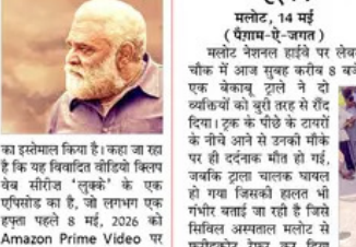
महिलाओं के खिलाफ़ टिप्पणी के मामले में योगराज सिंह फ़र केस दर्ज

पंजाब महिला आयोग ने नौटंडर जारी किया, वेब सीरीज के डायलॉग्स पर आपत्ति दर्ज चंडीगढ़, 14 मई (पैगाम-ए-जगत) - पूर्व भारतीय क्रिकेटर योगराज सिंह के पिता और अभिनेता योगराज सिंह एक बार फिर विवादों में फिर गए हैं। चंडीगढ़ पुलिस ने दो वकीलों की शिकायत पर योगराज सिंह के खिलाफ़ मामला दर्ज किया है। यह कार्रवाई सोशल मीडिया पर आयात हो रहे एक वीडियो के आधार पर की गई है, जिसमें योगराज सिंह इन इलाकों में भी इस मामले का संलग्न किया है।