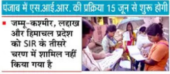
पंजाब में एस.आई.आर. की प्रक्रिया 15 जून से शुरू होगी

चंडीगढ़, 14 मई (पैगाम-ए-जगत) - भारत का चुनाव आयोग 15 जून से पंजाब में एस.आई.आर. (विशेष संतोष) की प्रक्रिया शुरू कर रहा है। भारत का चुनाव आयोग तीसरे चरण के तहत 16 राज्यों में एस.आई.आर. शुरू कर रहा है, जिसमें पंजाब को भी शामिल किया गया है। पंजाब में फिलहाल करीब 2.14 करोड़ मतदाता हैं। आने वाले पंजाब विधानसभा चुनावों को देखते हुए मतदाता सुविधों के विशेष संतोष की प्रक्रिया महत्वपूर्ण है। विधायी दलों ने इस संतोष पर कर कड़ी नज़र रखने का फैसला किया है। पंजाब में एस.आई.आर. के बाद आसिम मन्दाहा सुविधा 1 अक्टूबर को प्रकाशित की जाएगी। पंजाब में 15 जून से 24 जून तक एस.आई.आर. के लिए एक विशेष