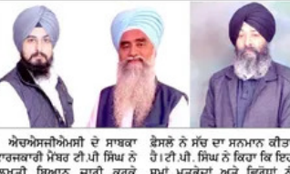
ਮੀਰੀ ਪੀਰੀ ਮੈਡੀਕਲ ਕਾਲਜ ਸਬੰਧੀ ਹਾਈ ਕੋਰਟ ਫ਼ੈਸਲੇ ਦਾ ਸਿੱਖ ਆਗੂਆਂ ਨੇ ਕੀਤਾ ਸਵਾਗਤ।