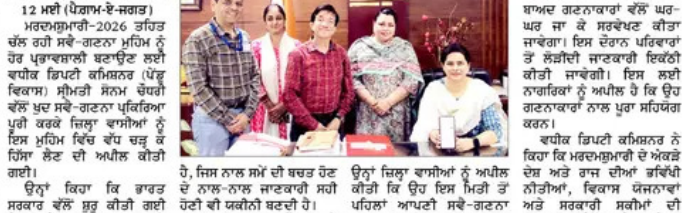
ਏ.ਡੀ.ਸੀ. ਸੈਮੀਨੀ ਸੈਮੀਨੀ ਵੱਲੋਂ ਮਰਦਮਸ਼ੁਮਾਰੀ-2026 ਤਹਿਤ ਸਵੈ-ਗਣਨਾ ਕਰਕੇ ਲੋਕਾਂ ਨੂੰ ਕੀਤਾ ਜਾਗਰੂਕ।